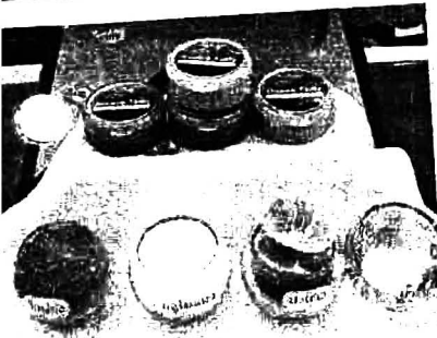
วัตถุดิบที่ใช้ในการผลิต ประกอบด้วย ใบฝรั่ง กลูโคสผง มะนาว และน้ำ

แนวความคิดขึ้นมาว่า เราจะทำให้ได้ จึงลองหาสมุนไพรใกล้ตัวและมีอยู่ในท้องถิ่น ราคาไม่แพง คิดถึง ใบฝรั่ง ขึ้นมาทันที เพราะเป็นของใกล้ตัว ที่เป็นที่รู้จักอยู่แล้วว่า ระบุบกลิ่นปาก ยามที่ดื่มสุรา สิ่งหนึ่งที่เห็นชาวบ้านทำกันอยู่เป็นประจำคือ เด็ดใบฝรั่งมาเคี้ยว เพื่อระบุบกลิ่น ครั้นจะพอกใบฝรั่งเป็นใบๆ ให้ตุงกระเป๋ามันก็ลำบาก เพื่อนๆ จึงคิดว่า น่าจะมีการแปรรูป จึงสรุปได้ว่า นำทำเป็นเม็ดอมสมุนไพรดีกว่า โดย