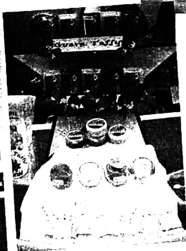
ผลงานที่บรรจุในผลิตภัณฑ์ พร้อมจำหน่าย